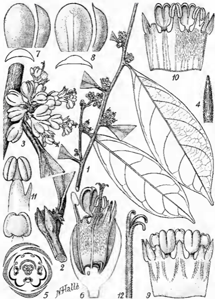
Fig. 2. — Tapura neglecta N. Hallé et Heine ( Le Testu n° 6696) : 1, rameau florifère; 2, bourgeon terminal; 3, inflorescence; 4, bractée florale; 5, diagramme floral; 6, coupe longitudinale de la fleur; 7, sépale externe, face, profil et coupe; 8, sépale interne; 9, corolle à plat, vue externe; 10, id. en vue interne, pilosité supprimée à gauche; 11, anthère, face interne et face externe; 12, extrémité du style. — Dimensions dans le texte.